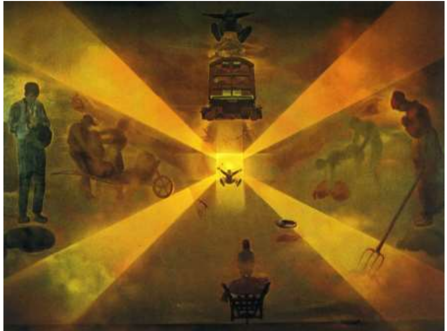
La gare de Perpignan

Né de relations amicales entre Breton, Eluard et Aragon, le surréalisme est une provocation intellectuelle qui remet en cause la pensée et l'art classique, tout en sensibilisant la raison et l'humour.